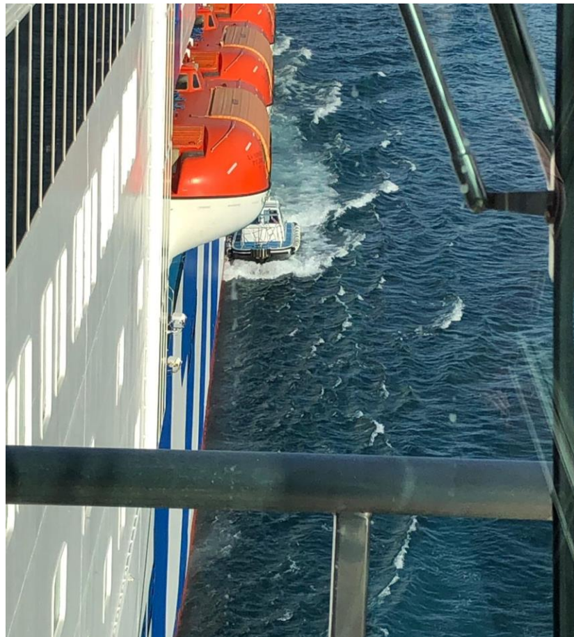
In navigazione durante un viaggio Genova-Palermo su nave GNV.