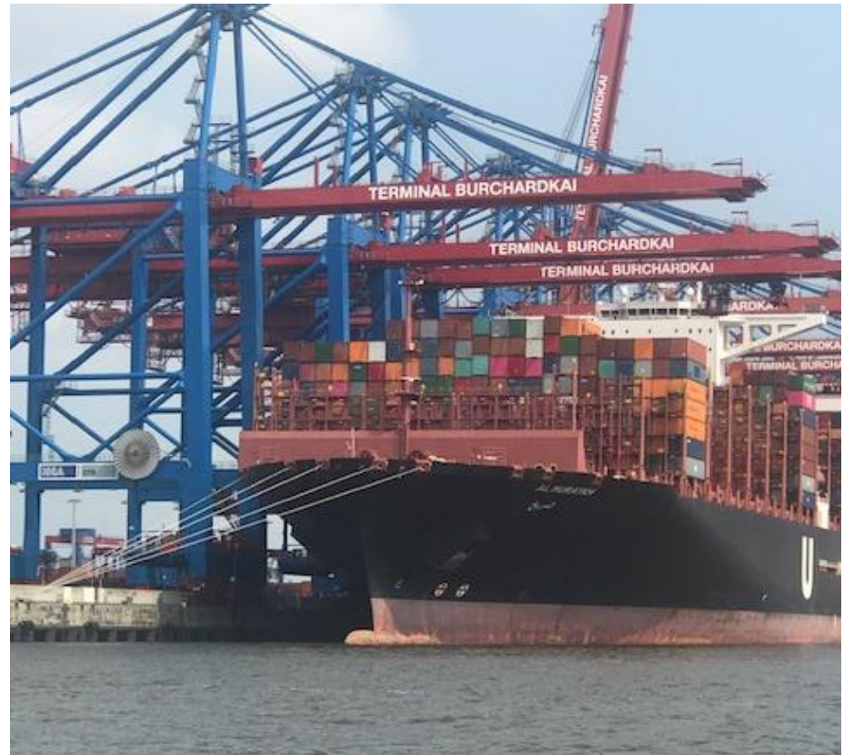
Terminal container nel porto di Amburgo (2019).