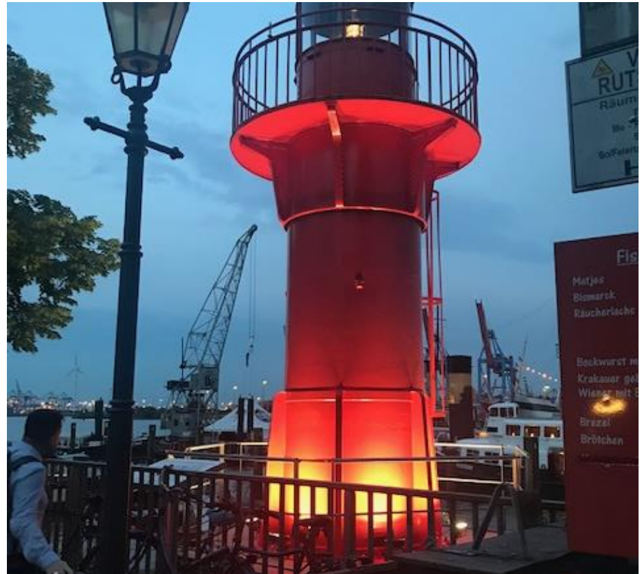
Il faro del porto di Amburgo (2019)